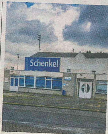
▲ Sporthal Schenkel is toe aan vernieuwing.

Als het aan Leefbaar Capelle ligt, betekent uitstel echter geen afstel. „Sport was, is en blijft een prioriteit. Wij zetten ons al jaren in voor voldoende, en goede, sportfaciliteiten en blijven voorstander van een mooie en veilige